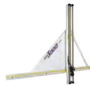
F3000 Coupeuse multi-matériaux 04-711 (48 po) 04-712 (60 po)

Support Pièce N° 12-225 Lames de rechange Pièce N° 05-711