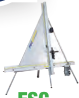
FSC Coupeuse multi-matériaux Pièce N° 04-720

Matériaux composites en aluminium (ACM)*