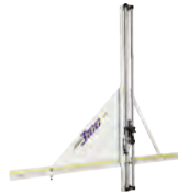
F3100 Coupeuse multi-matériaux Pièce N° 04-715

Support de lame avec (2) lames incluses Pièce N° 04-779 Lame de rechange Pièce N° 05-233